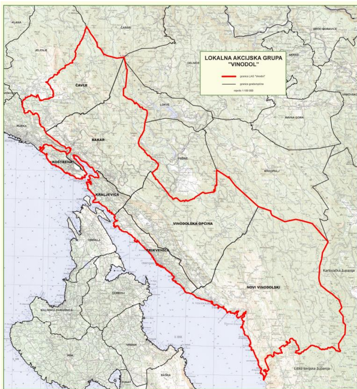
Slika 1. Karta LAG područja s vidljivim granicama JLS-ova u LAG-u