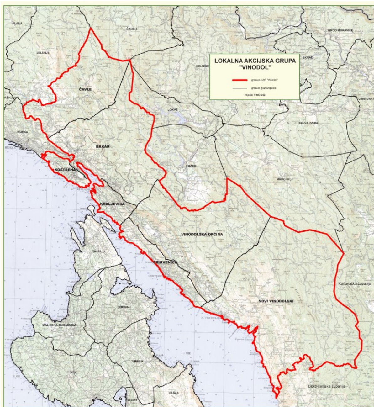
Slika 1. Karta LAG područja s vidljivim granicama JLS-ova u LAG-u