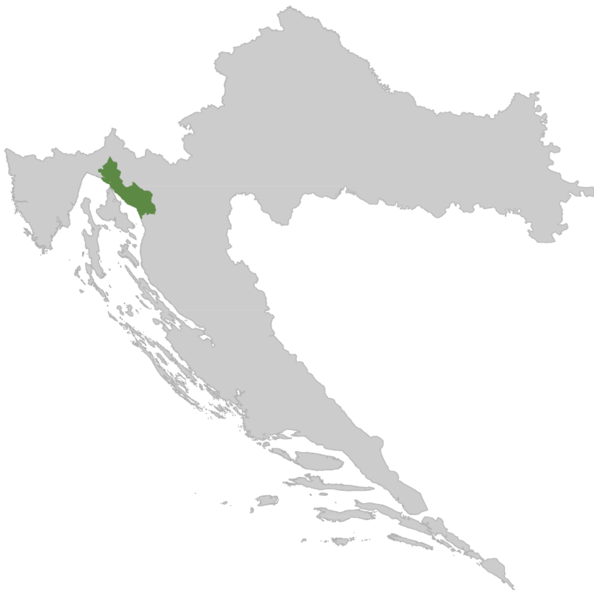
Slika 2: Karta položaja LAG-a na karti Republike Hrvatske