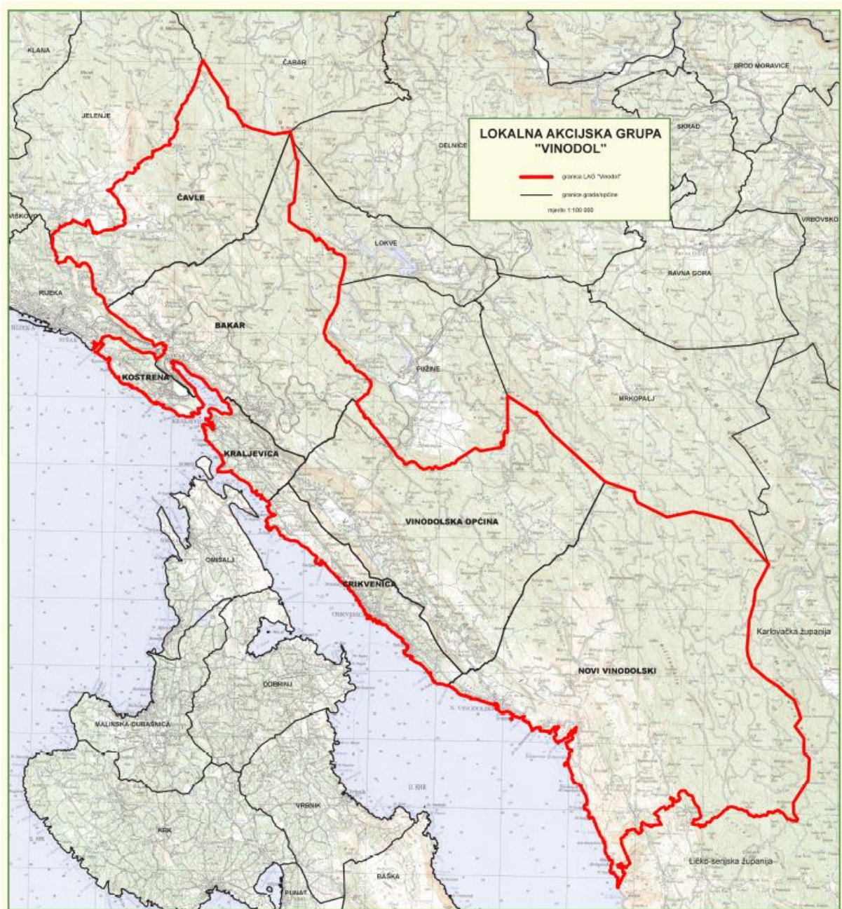
Slika 1. Karta LAG područja s vidljivim granicama JLS-ova u LAG-u